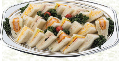
グランビアン特製 ◆ファミリー サンド (3人用) 本体価格 2,600円 (税込2,808円)