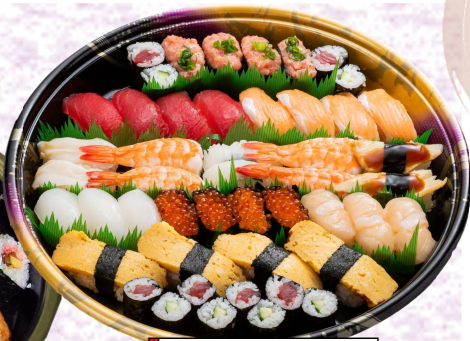
◆虹寿司 〈3~4人前〉 本体価格 4,800円 (税込5,184円)