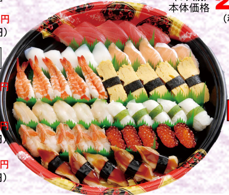
◆葵寿司(助六寿司) 〈5人前〉 本体価格 2,700円 (税込2,916円)