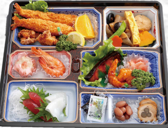
◆つどい御膳 (白ご飯付き) 本体価格 2,800円 (税込3,024円)