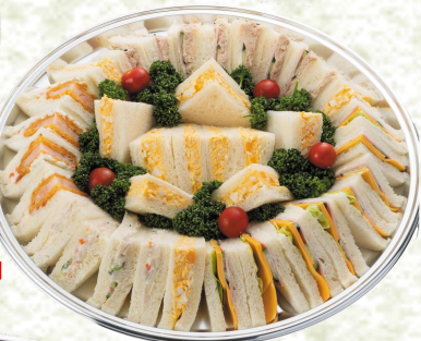
グランビアン特製 ◆ロイヤルサンド (4~5人用) 本体価格 3,800円 (税込4,104円)