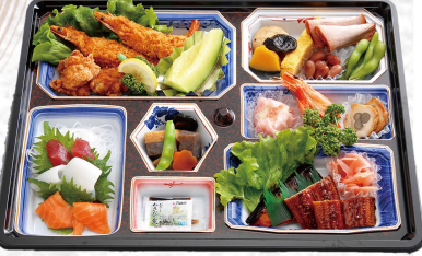
◆おもむき御膳 (白ご飯付き) 本体価格 3,700円 (税込3,996円)

お祝い、法事、各種行事にご利用ください。 ※本体価格合計1万円以上で 配達いたします。