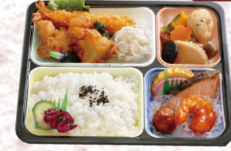
◆いこい弁当 本体価格 800円 (税込864円)