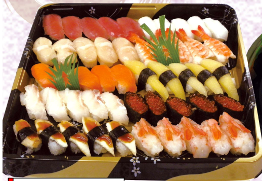
◆錦寿司 〈5人前〉 本体価格 6,300円 (税込6,804円)