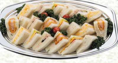
グランビアン特製 ◆ファミリー サンド (3人用) 本体価格 2,300円 (税込2,484円)