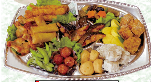
◆ぐるめハートフル 〈4~5人前〉 本体価格 3,980円 (税込4,299円)