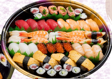
◆虹寿司 〈3~4人前〉 本体価格 4,500円 (税込4,860円)