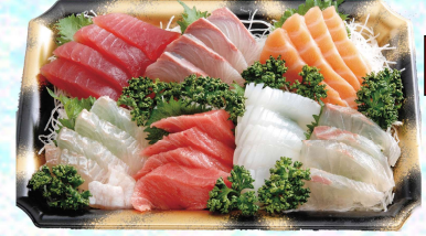
◆宴盛 (うたげもり) (中トロ入り) 〈7点盛〉 本体価格 3,980円 (税込4,299円)