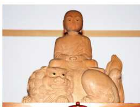
もんじゅぼさつ 文殊菩薩像